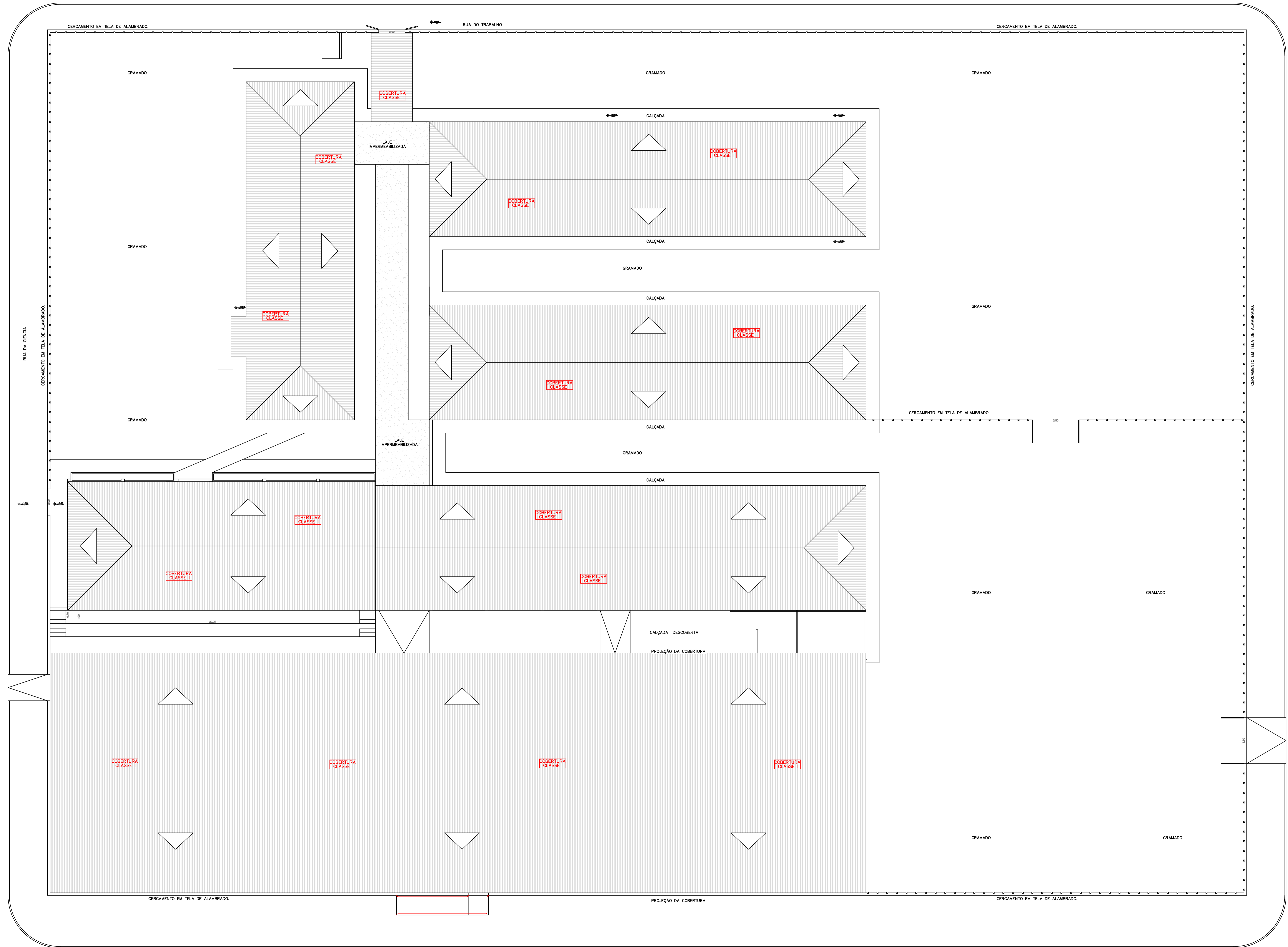
PLANTA - COBERTURA ESCALA 1:100